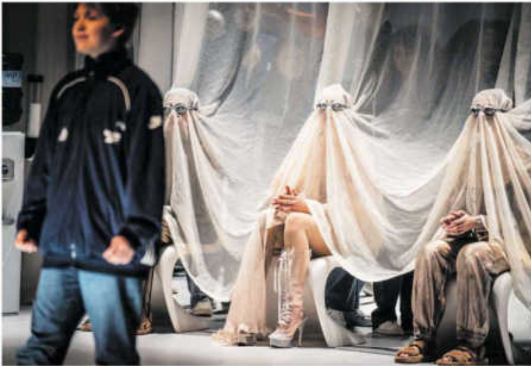
Een scène uit LOOK , een geestelijke voorstelling van Gebied B, De Steeg, Jonge Harten Theater Festival & De Noorderlingen.